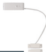
Détecteur d'ouverture pour menuiserie aluminium