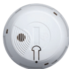
Détecteur de fumée