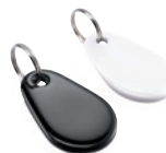
Lot de 2 badges