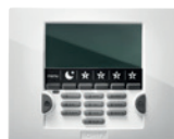
Clavier LCD blanc + 1 badge