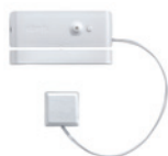
Détecteur d'ouverture et bris de vitre