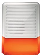
Sirène extérieure avec flash