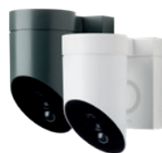
Somfy Outdoor camera